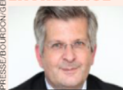
Par Arnaud Puiseux Associé de Gefip