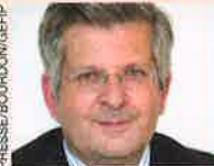
Par Arnaud Puiseux Associé de Gefip